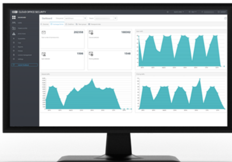
Panel de control de ESET Cloud Office Security